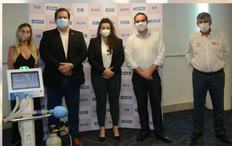
Parcerias que fortalecem p. 01