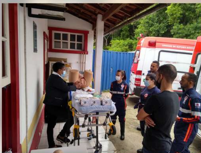
Base de Tiradentes marca presença no treinamento do NEP p. 03